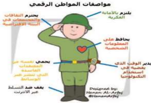
شكل رقم (١): مواصفات المواطن الرقمي